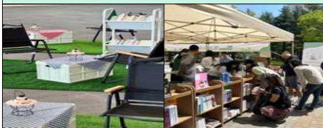
북 피크닉 존